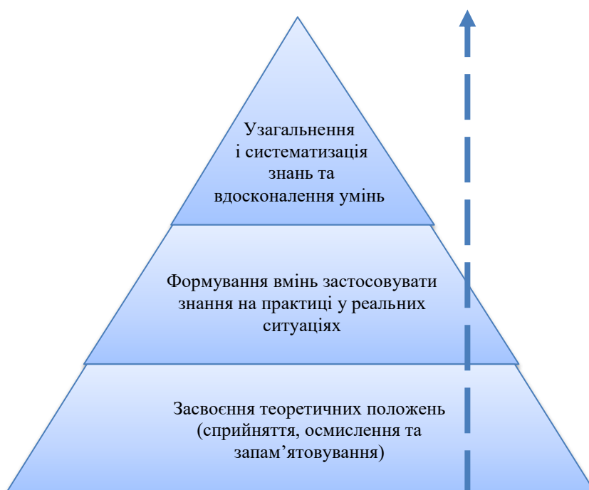
Рис. 2. Етапи формування у здобувачів професійно-педагогічних знань і вмінь

Зазначимо, що в основу методики формування в здобувачів професійно-педагогічних знань і вмінь нами покладено підхід Г. Атанова, згідно з яким, знання відіграють роль схем орієнтувальної основи діяльності та реалізуються за допомогою умінь. Реалізація методики формування професійно-педагогічних знань і вмінь у здобувачів передбачає виконання відповідної послідовності етапів, яку наведено на рис. 2.